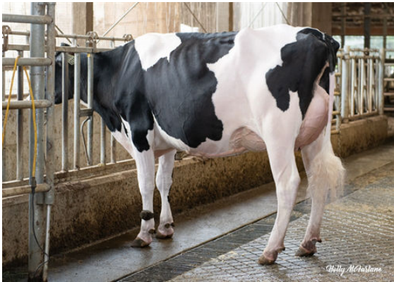
PROGENESIS MONTB ENERGIZER P DAM